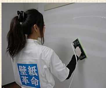
クロスメイク施工中